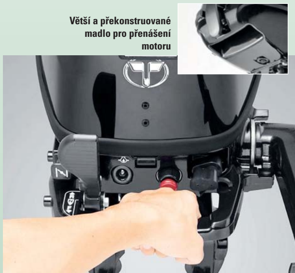
Větší a přestavované madlo pro přenášení motoru

Konstrukčně se jedná o jednoválcové čtyřtaky s objemem 123 cm 3 a hmotností 25 kg. S vrtulí 7 x 9" činí maximální otáčky 5 500 ot./min. Zapalování je typu CD s příčným sáním a chladicí systém řídí termostat. Nádrž na motoru má objem 1,1 litru, dá se však použít externí palivová nádrž o objemu 12 litrů.