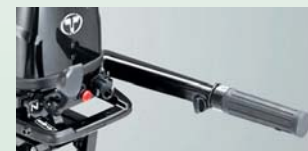
O 110 mm delší řídící páka