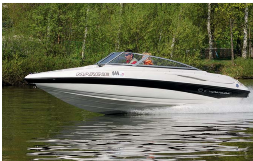
Testovaný člun poháněl motor MerCruiser 3,0 L, s nímž se dvěma členy posádky na palubě snadno dosáhl maximální rychlosti 60 km/h.