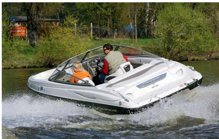
Crownline 185 SS je obratný a snadno se ovládá.

story a nerezové držáky nápojů. K vyvazování člunu slouží nerezové výsuvné vazáky a oka. V základní výbavě najdeme ještě vestavěnou palivovou nádrž, poziční světla, kotevní světlo a bilge pumpu.