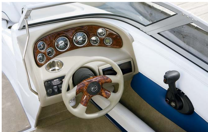
Palubní deska obsahuje standardní přístroje, jako jsou rychloměr, otáčkoměr či ukazatele stavu paliva, baterie a teploty motoru.

Protože jsou bowridery vhodné také pro vodní lyžování, je na zádi upevněno nerezové oko pro vlečení lyžaře a v podlaze kokpitu je velký prostor pro uskladnění vodních lyží, wakeboardu, neoprenů, vest a další potřebné výbavy.