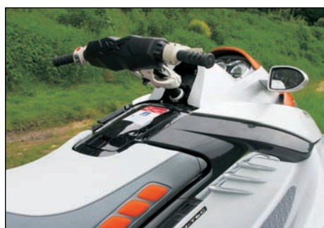
RXT-X má velmi ergonomická říditka s jemným ovládáním plynu. Nechybí ani zpětná zrcátka.