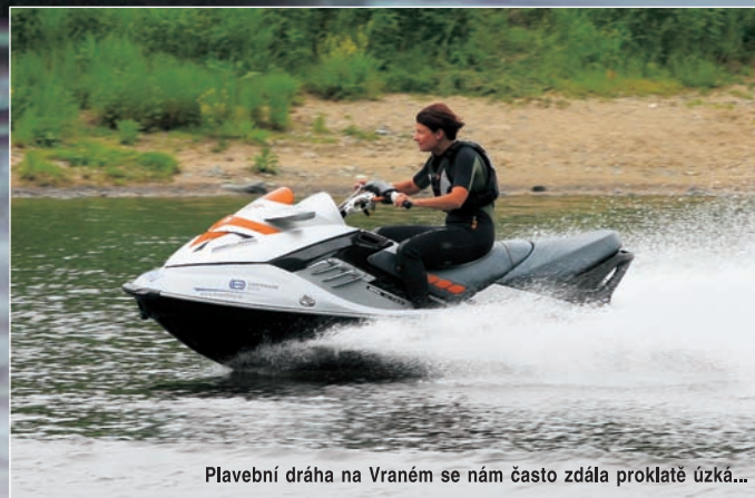
Plavební dráha na Vraném se nám často zdála proklatě úzká...