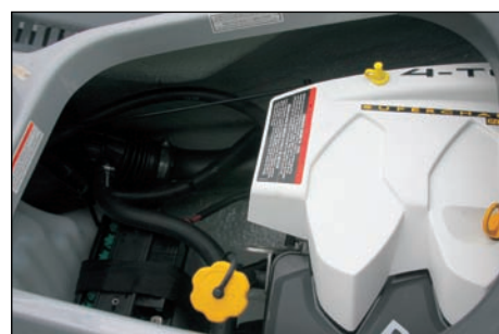
Palivová nádrž, mazání a baterie