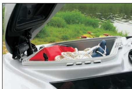
Rozměrný zavazadlový prostor

modelech už se používají zpátečky, což dříve bylo běžné jen u třímístného skútru. Nové modely jsou stabilnější, mají větší plováky, které zajišťuje větší bezpečnost plavby," dodává.