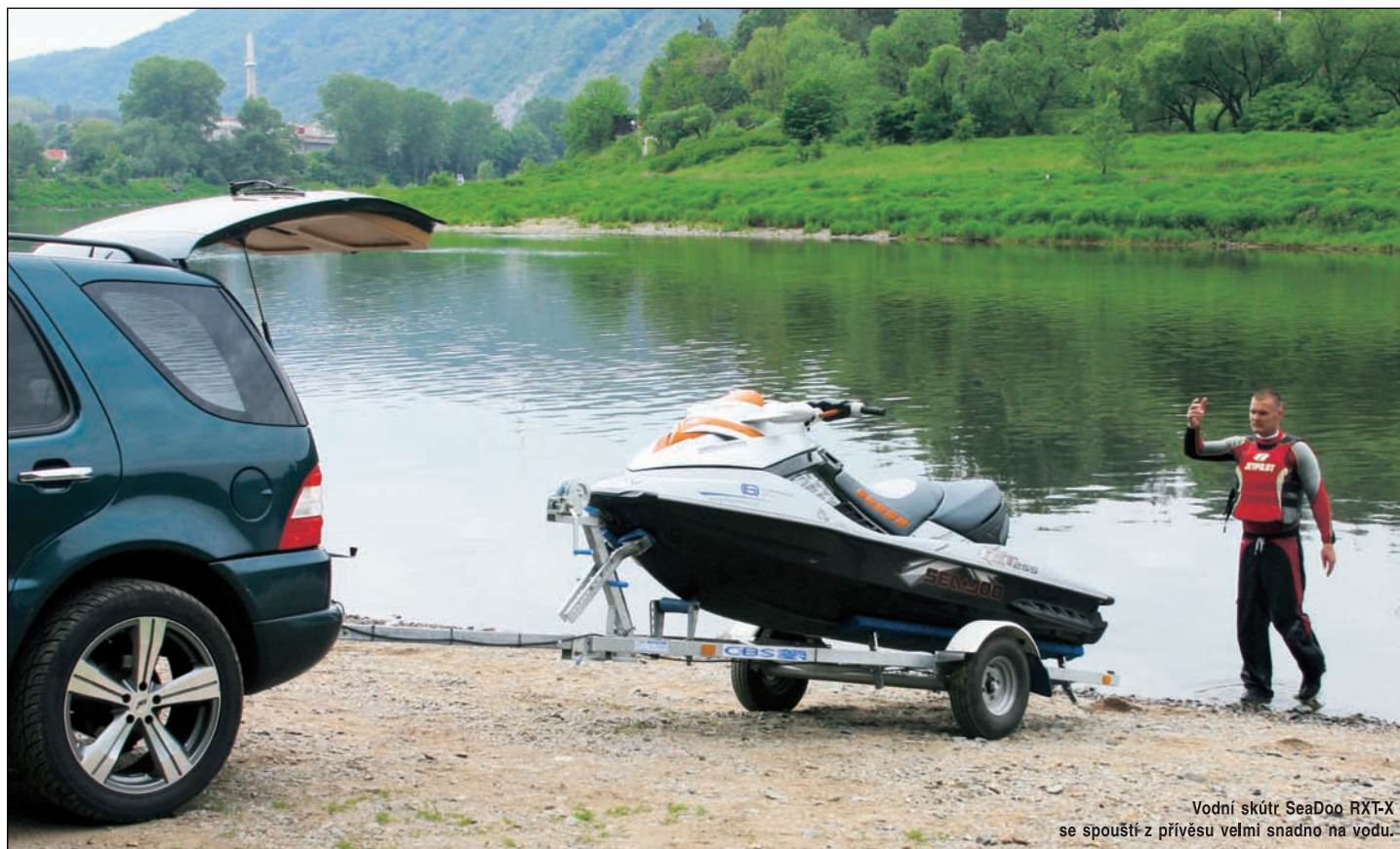
Vodní skútr SeaDoo RXT-X se spouští z přívěsu velmi snadno na vodu.