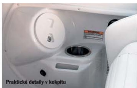
Praktické detaily v kokpitu