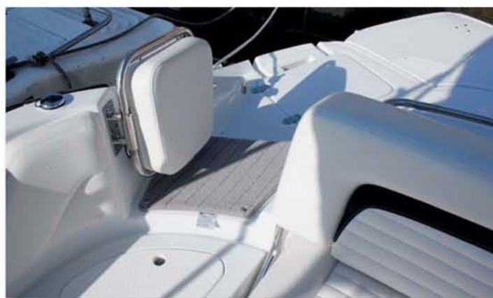
Průchod na koupací plošinu