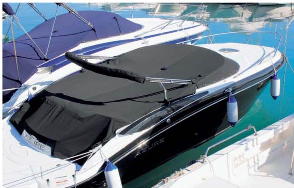
V příplatkové výbavě nechybí perseník na zakrytí lodě.