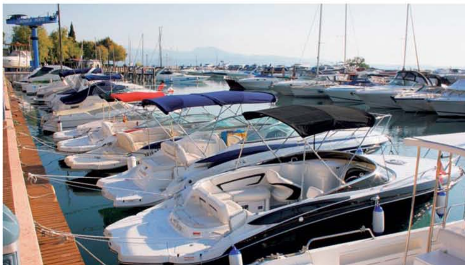
Test probíhal na Gardě v malém městečku Moniga del Garda.

Tento prostorný laminátový člun s obytnou kajutou se vyznačuje elegantním, funkčním a komfortním designem, agresivním vzhledem i dobrými jízdními vlastnostmi. Testovaný člun byl ve verzi Z-class, která na první pohled zaujme černou barvou trupu s kontrastní bílou palubou a bílým dnem do hlubokého „V“. K vysoce sportovnímu designu přispívá i nízký ochranný plexi štít. Na palubě najdeme velký prostor s pohodlnými sedadly s úpravou pro slunění, s množstvím odkládacích skříňek, objemným zavazadlovým prostorem na zádi a uzavíratelným boxem pro vodní lyže v podlaze. Musíme vyzdvihnout kvalitu vyhotovení i použitých materiálů. Na pravé straně je moderní palubní deska v černém provedení s masivním volantem, všemi příslušnými ukazateli stavu motoru a pákou