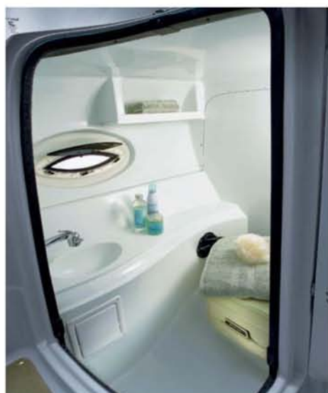
Velice praktická je samostatná místnost s WC, umyvadlem a sprchou.