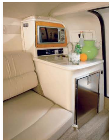
Nechybí kuchyňka s chladničkou a dřezem.