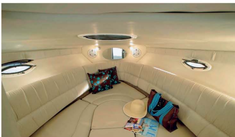
Jídelní kout lze přestavět na dvojlůžko.