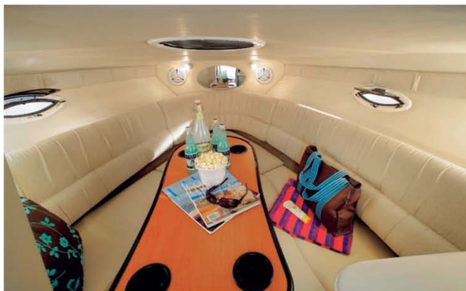
Dobře vybavená kajuta se zdá být velmi prostorná.