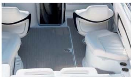
Pod podlahou kokpitu se nachází úložný prostor na vodní lyže či wakeboard.

Firma ovšem nabízí mnoho dalšího volitelného příslušenství, které z Azure 279 Cuddy udělá vskutku luxusní člun. Zákazník má samozřejmě možnost zvolit si barvu lodě podle vlastního vkusu. Z navigační výbavy je k dispozici kompas a GPS s pětipalcovým disple-