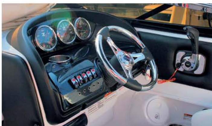
Na pravé straně je moderní palubní deska v černém provedení s masivním volantem, všemi příslušnými ukazateli stavu motoru a pákou plynu a řazení na boku.