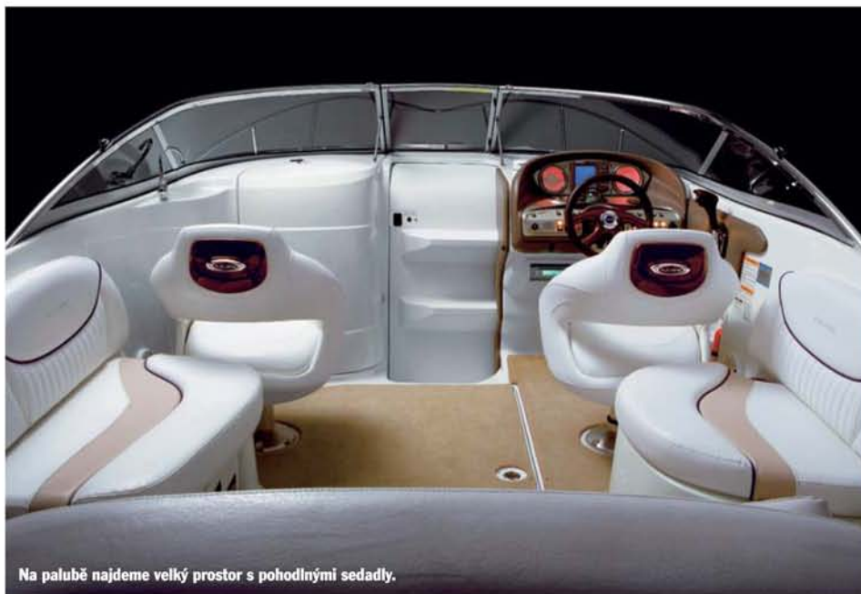
Na palubě najdeme velký prostor s pohodlnými sedadly.

plynu a řazení na boku. Ve výbavě nechybí ani AM/FM rádio s CD přehrávačem a čtyřmi reproduktory. Loď je zakončena rozměrnou koupací plošinou s nerezovým žebříkem. Ochranu před prudkým sluncem zajišťuje stříška bimini opět v černé barvě.