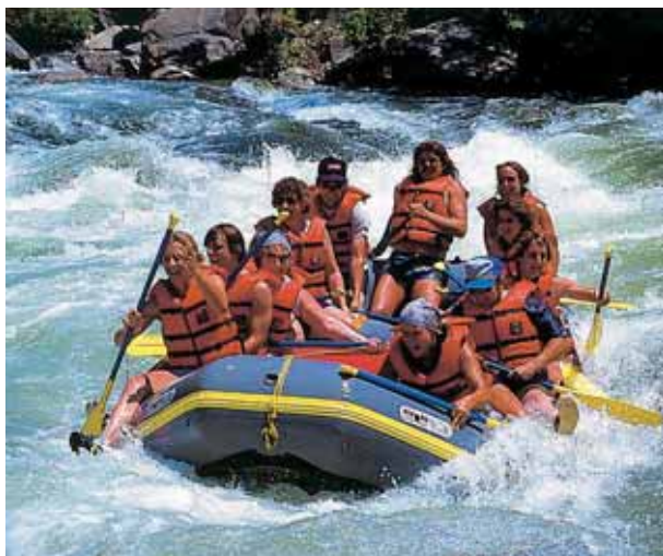
Člun pro rafting