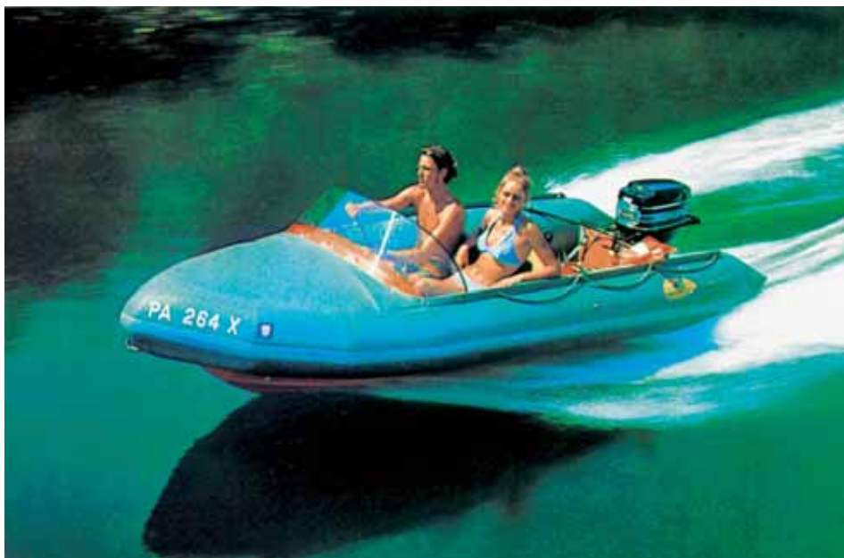
Searider z roku 1972