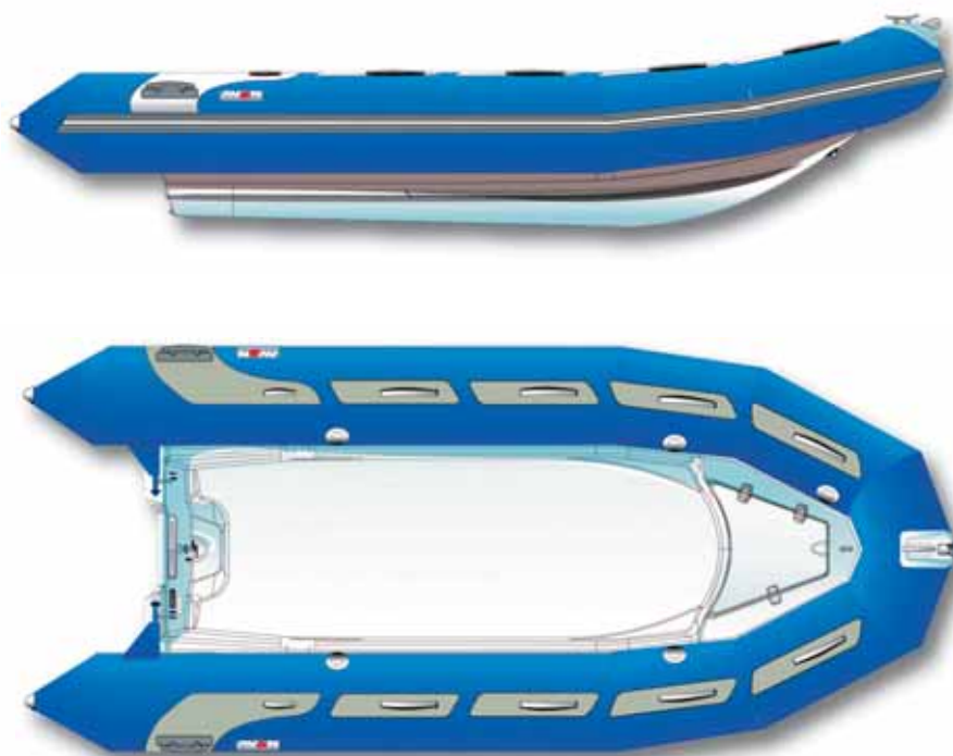
Adventure 470 Blue