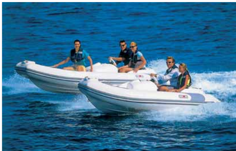
Seasport Jet Range

osmdesátých let plně etabloval na světových trzích a rovněž úspěšně expandoval. V roce 1988 koupil francouzskou továrnu na výrobu nafukovacích člunů Sillinger, čímž si vytvořil evropskou základnu pro výrobu a vynikající odrazový můstek pro evropský trh. Aby si zajistil větší kontrolu také nad americkým trhem, koupil v roce 1984 kalifornskou firmu Seagull Marine. Nově vzniklá dceřiná společnost Avon Seagull Marine se stala výhradním dodavatelem a prodejcem člunů Avon ve USA. Export do zahraničí tvořil v této expanzivní době 75 % celkového obrátu firmy.